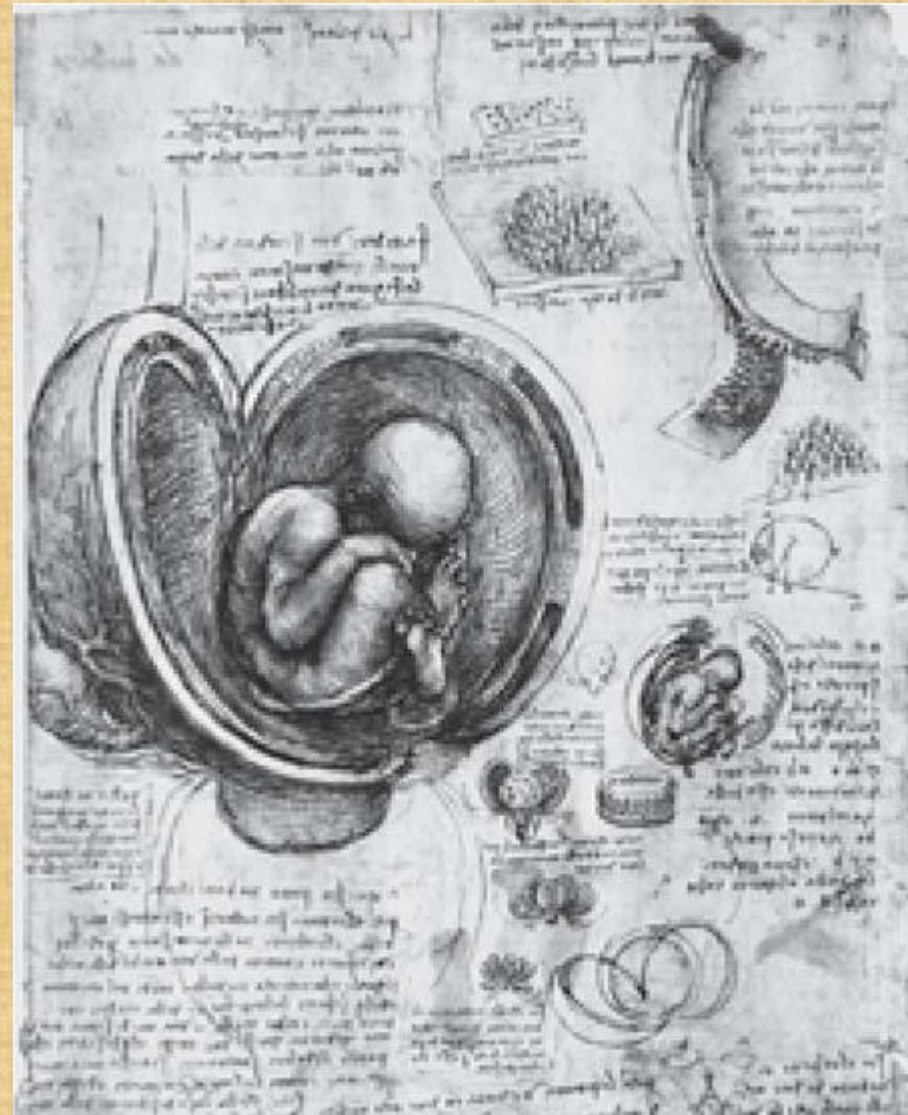
Dessin de Léonard de Vinci – extrait d'un cahier d'anatomie vers 1510, collections royales, Windsor

https://www.pinterest.it/cherbourgeoise/leonard-de-vinci/