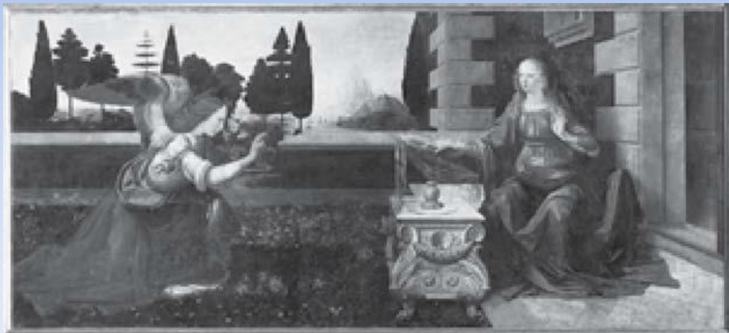
L'Annonciation de Léonard de Vinci - huile sur bois, vers 1472-1475, 98 x 217 cm, Galerie des Offices, Florence

Vous pouvez aussi consulter le site Internet du musée de Florence: http://www.virtualuffizi.com