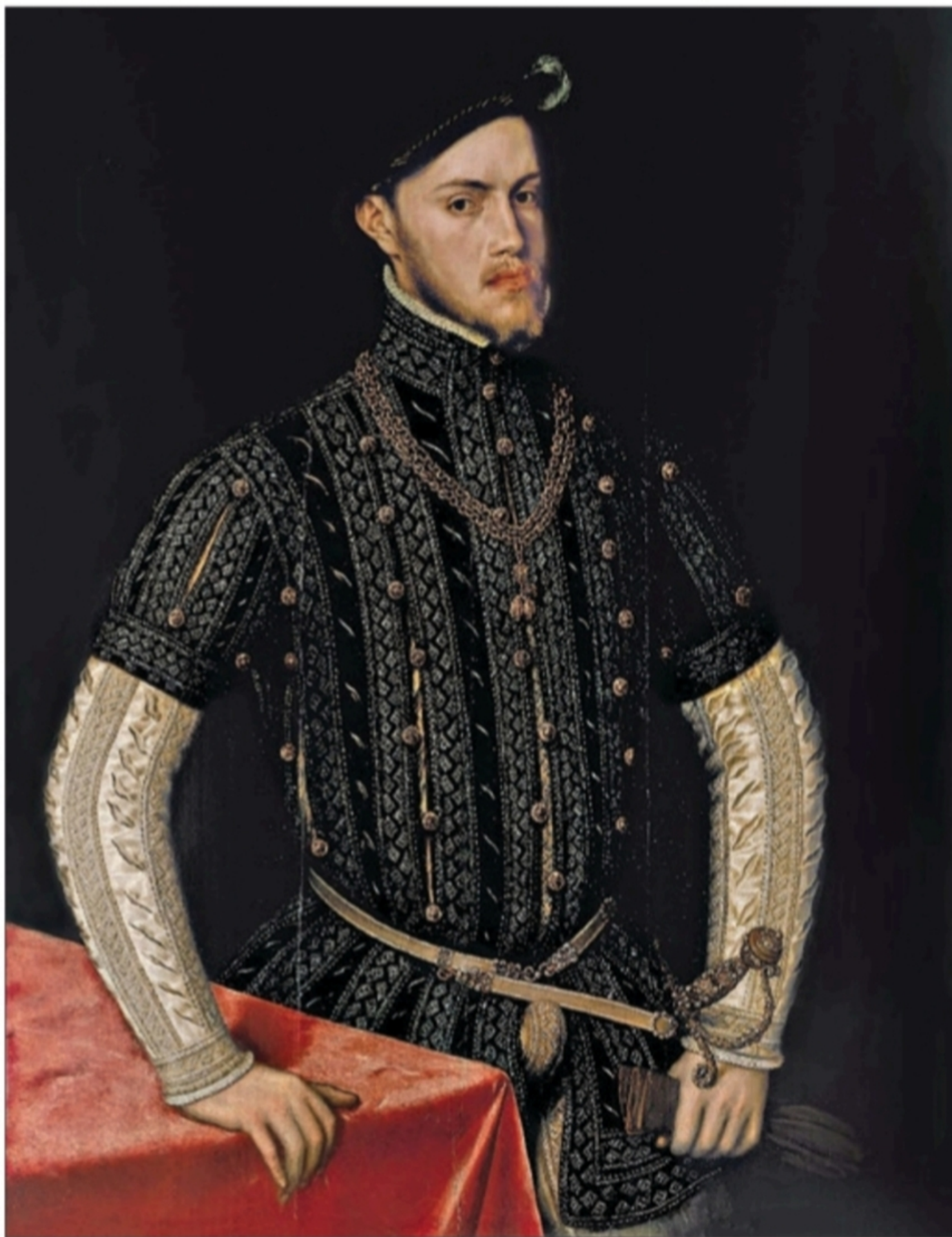
Antonio Moro, Ritratto di Filippo II di Spagna, 1549-1550