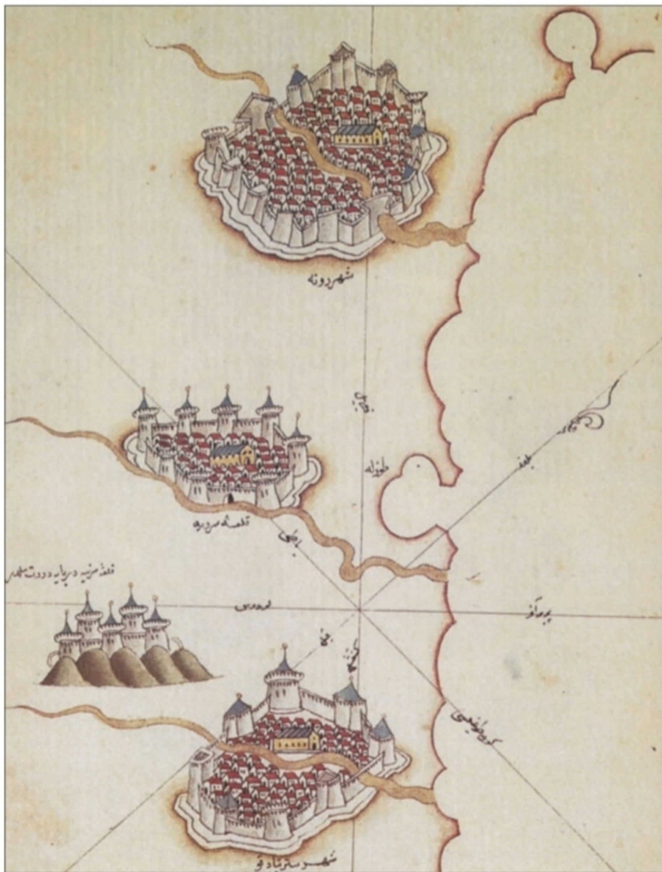
Le città-porto di Ravenna, Cervia, Cesenatico e più all'interno, la città di Cesena (da E. Turri, a cura di, Adriatico mare d'Europa. La cultura e la storia , Arti Grafiche A. Pizzi, Cinisello Balsamo 2000, pp. 152-153)