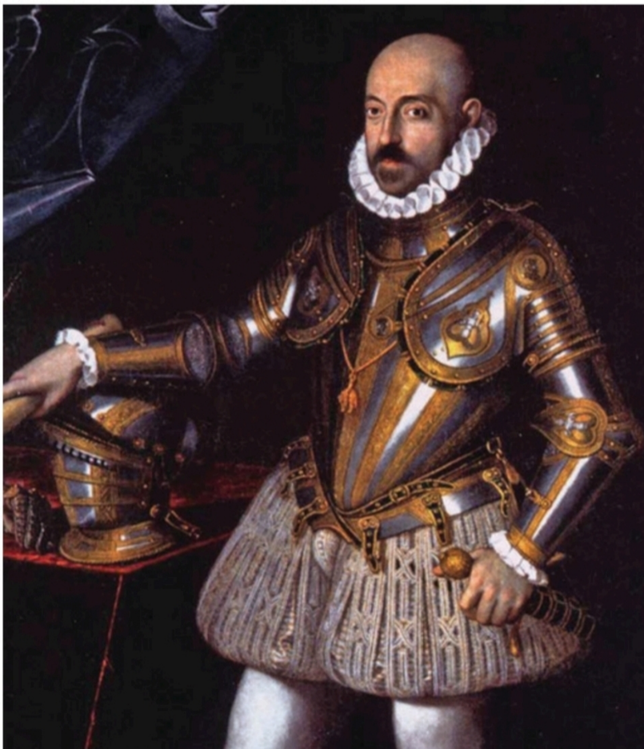
Ritratto di Marcantonio Colonna ( https://it.wikipedia.org/wiki/File:Marcantonio_Colonna.jpg )