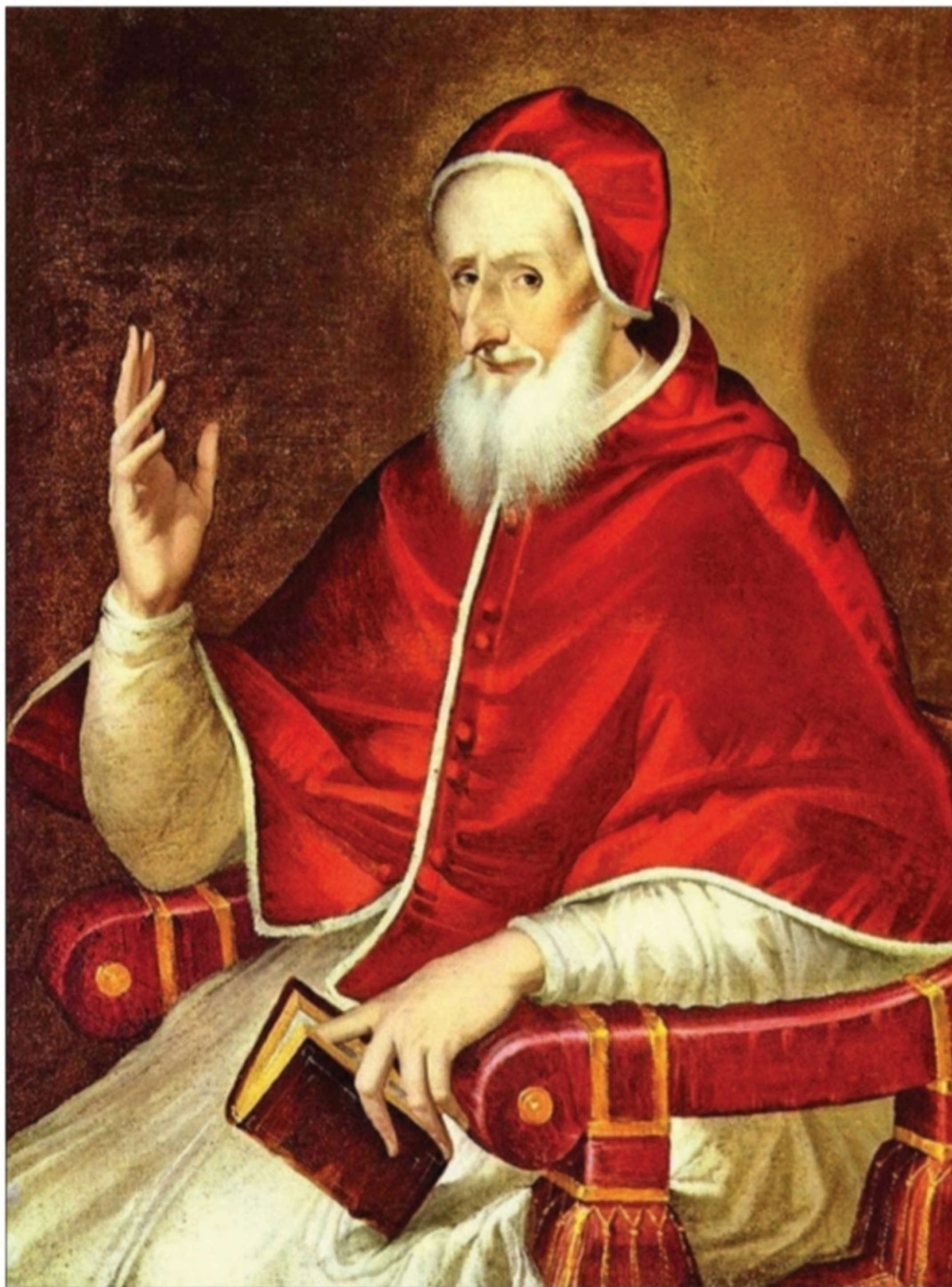
El Greco, Ritratto di Pio V, 1600-1610 ( https://it.wikipedia.org/wiki/Papa_Pio_V#/media/File:El_Greco_050.jpg )