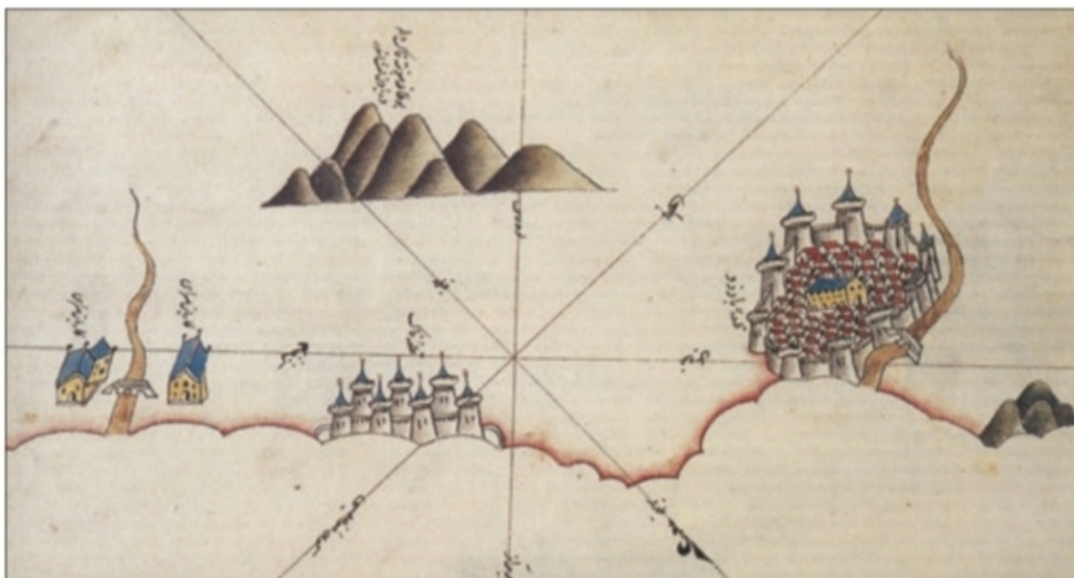
Il fiume Metauro (a destra), con un ponte in pietra, le colline del Montefeltro, Pesaro e il fiume Foglia (da E. Turri, a cura di, Adriatico mare d'Europa. La cultura e la storia , Arti Grafiche A. Pizzi, Cinisello Balsamo 2000, pp. 152-153)