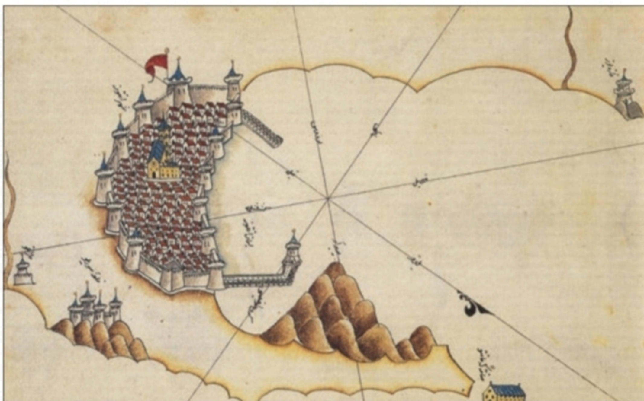
Ancona con il Monte Conero, Santamaria di Portonovo e Sirolo (da E. Turri, a cura di, Adriatico mare d'Europa. La cultura e la storia , Arti Grafiche A. Pizzi, Cinisello Balsamo 2000, pp. 152-153)